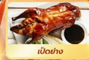
เป็ดย่าง