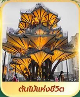
ต้นไม้แห่งชีวิต