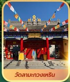
วัดลามะกวงเหริน