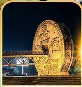
จัตุรัสเหรียญโบราณ