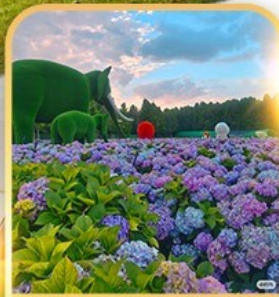
ดอกไม้ตามฤดูทง