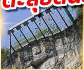
ระเบี่ยงแก้วอู่หลง