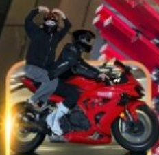
ถ่ายวีดีโอนั่งมอเตอร์ไซด์

ชิมหม้อไฟหม่าล่า นั่งรถรางชมธรรมชาติ หวาดเสียวระเบียงแก้ว