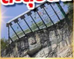
ระเบียงแก้วอุหลง