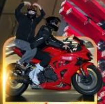
ถ่ายวีดีโอน้องมอเตอร์ไซค์

ชิมหม้อไฟหม่าล่า นั่งรถรางชมธรรมชาติ หวาดเสียวระเบี่ยงแก้ว