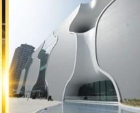
โรงละครโดง