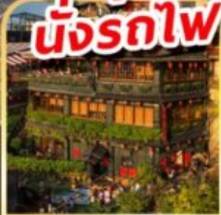
หมู่บ้านโบราณฉิวเฟิน