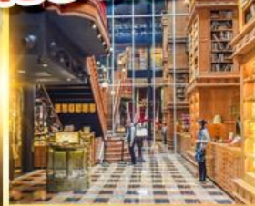
ร้านไอศกรีมมียาฮาร่า