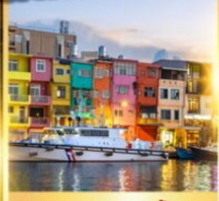
ท่าเรือประมงเจิ้งปิง