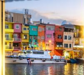
ท่าเรือประมงเจิ้งปิง