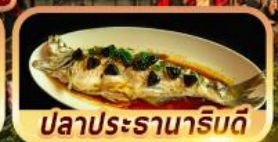
ปลาประรานาริมดี