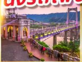
สะพานต๋าซี