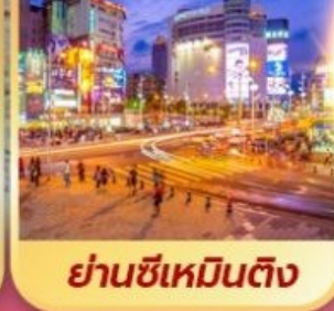
ย่านซีเหมินตง