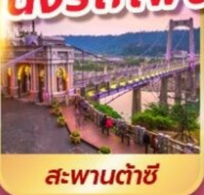
สะพานต้าชี่