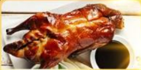
เปิด Four Season