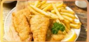
Fish and Chips