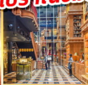
ร้านไอศกรีมมियाฮาร่า