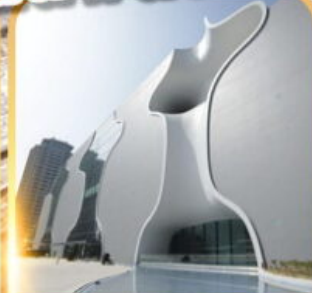
โรงละครไถจง