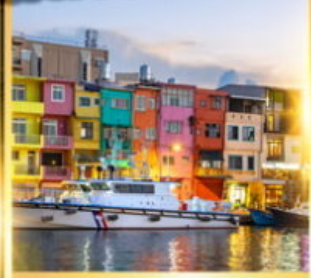
ท่าเรือประมงเจิ้งปิง