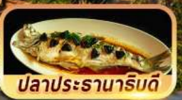
ปลาประรานาภิรมดี