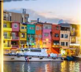
ท่าเรือประมงเจิ้งปิง