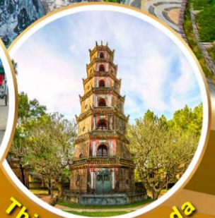
Thien Mu Pagoda