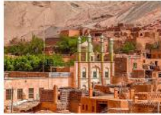
เมืองเกาคัซการ์