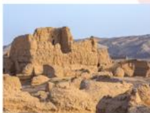
เมืองหินทาชเคอร์กัน