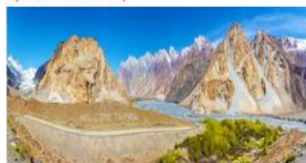
หุบเขาพาสส์ (Passu Valley)

*ที่พัก Passu : Sarai Silk Route Hotel หรือเทียบเท่า