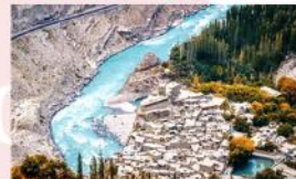
หมู่บ้าน Hopper Valley

*ที่พัก Gilgit : Kellisto Hotel หรือเทียบเท่า