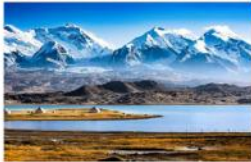
ทะเลสาบคาราคูล