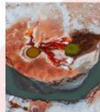
ภูเขาไฟโคลน