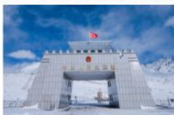
ด่านชายแดนหงฉีลาฝู