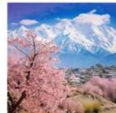
Rakaposhi Galcier View Point