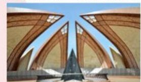
อนุสาวรีย์ปากีสถาน

*ที่พัก Islamabad : Hillview Islamabad หรือเทียบเท่า