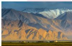
พระอาทิตย์ขึ้นที่ภูเขาเมฆหัด อะทา