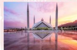
มัสยิดไฟซาล (Faisal Mosque)

*ที่พัก Islamabad : Hillview Islamabad หรือเทียบเท่า