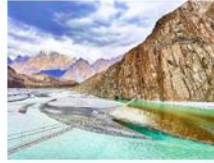
สะพานแขวนสุสไซนี