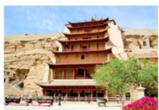
ถ้ำม่อเกาคุ