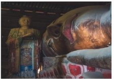
วัดพระใหญ่จางเย่