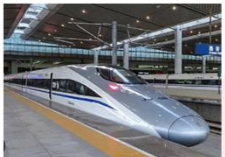
สถานีรถไฟความเร็วสูง

08.29 น. ออกเดินทางสู่เมืองจางเย่ ด้วยรถไฟความเร็วสูง ขบวนที่ D2743 11.09 น. เดินทางถึงเมืองจางเย่