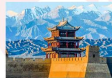
กำแพงเมืองด่านเจียอี้กวน

** พักที่ Cheng Feng Hotel 4* หรือเทียบเท่า **