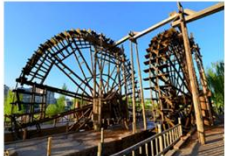
สวนกังหันวิดน้ำโบราณ

08.25 น. ออกเดินทางสู่เมืองหลานโจว เที่ยวบิน CZ8985 11.35 น. เดินทางถึงสนามบินหลานโจวจางซาน