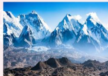
เทือกเขาเทียนชาน