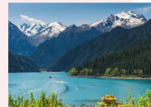
ร่องเรือทะเลสาบเทียนฉือ