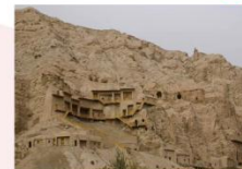
ถ้ำพระพันองค์