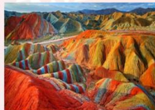
ภูเขาสายรุ้งจางเย่ตานเซีย

** พักที่ Pu Yue Hotel 4* หรือเทียบเท่า **