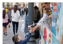
ไอศกรีม Maraş ชมพระอาทิตย์ตกดิน ณ ภูเขาเนมรุต