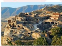
เมืองอพลิสซิค