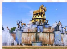
เมืองคูไทซี

** พักที่ Kutaisi Inn Hotel หรือเทียบเท่า **