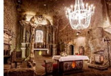
เหมืองเกลือวิลิชกา

** พักที่ Golden Tulip Krakow Hotel 4* หรือเทียบเท่า **