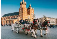
Krakow Old Town

05.15 น. เดินทางถึงสนามบินอิสตันบูล และเปลี่ยนเครื่อง 07.25 น. ออกเดินทางสู่สนามบินคราคูฟ เที่ยวบิน TK1271 08.45 น. เดินทางถึงสนามบินคราคูฟ ประเทศโปแลนด์