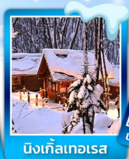
นิงเกิลเทอเรส