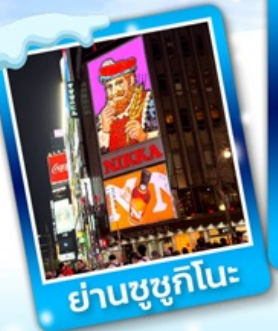
ย่านซูซุกิโนะ