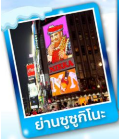
ย่านชูซุกิโนะ