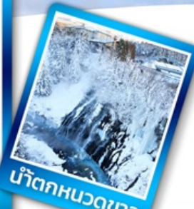
น้ำตกหมวดขาว