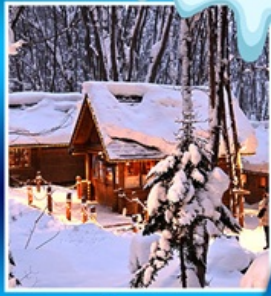
นิงเกิลเทอเร