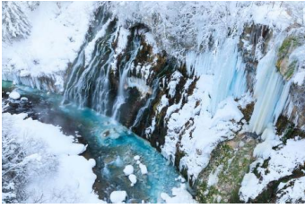
น้ำตกนี้ก็ไต่เช่นกัน

พาท่านเที่ยวชม น้ำตกชิโรฮิเงะ(Shirohige Water Fall) เป็นสถานที่ท่องเที่ยวทางธรรมชาติที่ติดอันดับ 1 ใน 5 ของน้ำตกที่สวยงามที่สุดในฮอกไกโด มีระดับความสูงประมาณ 30 เมตร ซึ่งน้ำตกแห่งนี้เป็นต้นน้ำของบ่อน้ำสีฟ้าแห่งนี้ น้ำที่ไหลจากน้ำตกจึงมีสีฟ้าอมเขียวสดใสเหมือนในบ่อน้ำสีฟ้าเลย นอกจากนี้แล้วบริเวณน้ำตกยังมีสะพาน Blue River Bridge ที่สร้างขึ้นสำหรับดูวิวและความสวยงามของสายน้ำสีฟ้านี้ เราสามารถเดินเล่นข้ามสะพาน หยุดถ่ายรูปกับน้ำตกชิโรฮิเงะ หรือ จะแค่นั่งมองวิวทิวทัศน์ของธรรมชาติรอบๆ