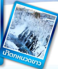
น้ำตกหมวดขาว