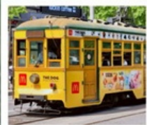
นั่งรถรางต้าเหลียน