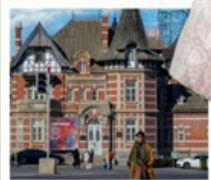
ถนนรัสเซีย