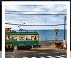
รถไฟเอโนะเด็ง