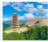
ภูเขาหนิวโถ้วซาน