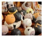
โรงงานเซรามิกเตาเอ๋อด่าง