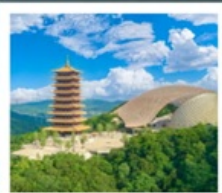
ภูเขาหนิวโถ้วซาน

อุทยานทะเลสาบไท่หู (รวมล่องเรือ) ถนนคนเดินซานตง • วัดจีหมิง ถนนอุ้งงงต้าเต้า • ห้างสรรพสินค้าเต๋อจี ภูเขาหนิวโถ้วซาน (รวมรถกอล์ฟ) สะพานแม่น้ำแยงซีเกียงนานกิง • ทะเลสาบเซวียนอู่ หมู่บ้านเหนียนฮวาวัน • โรงงานเซรามิกเกาเอ้อด่าง เมืองโบราณเหย่าหู (รวมรถไฟเล็ก) • คุณซาน ถนนโบราณปาเจิง • North Bund Green Land STARBUCKS RESERVE ROASTERY THE LOUIS • ถนนหวยไห่ (SONG MONT)