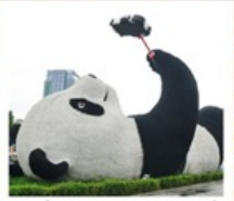
รูปปั้นหมีแพนด้าชหลี่