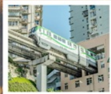
รถไฟฟ้าคะคุตัก