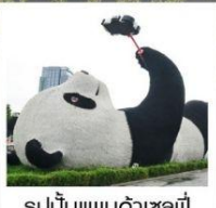
รูปปั้นแพนด้าเซลฟี่