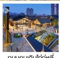
ถนนคนเดินไท่กู่หลี่