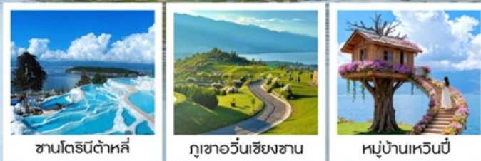
ซานโตรินี่ต้าหลี่

“เกาะเสี่ยวผู่...เกาะลึกลับกลางทะเลสาบ เอ้อไห้”