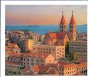
โบสถ์ ST. EMIL