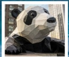
ห้าง IFS แพนด้าป็นตึก

จัดทริปหย่างเกี้ยนวู / รูปปั้นหมีแพนด้าเซลฟี / เมืองโบราณก้วนเซี่ยน คำธารสีฟ้า / อุทยานภูเขาสีดรุณี / อุทยานชวงเฉียวโกว (รวมรถอุทยาน) อุทยานปีงเิ่งโกว (รวมรถอุทยาน + รถแบตเตอรี่) / อุทยานจิวจ้ายโกว (รวมรถเหมา) ถนนคนเดินชุนชู่ / ห้าง IFS แพนด้าป็นตึก / ถนนคนเดินไท่กู่หลี่ ถนนคนเดินชอยกว้างแคว (POP MART)