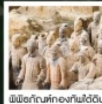
พิพิธภัณฑ์ทองคำฟงไต้ฉัน

ทัวร์คุณภาพ ไม่หลงร้านช้อปปิ้ง ไม่ขายของฝืน