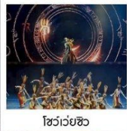
โชว์เว่ยซิว