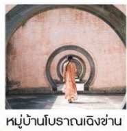
หมู่บ้านโบราณเฉิงชาน