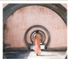
หมู่บ้านโบราณเจียงชาน