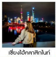
เซี่ยงไฮ้คลาสสิกไนท์