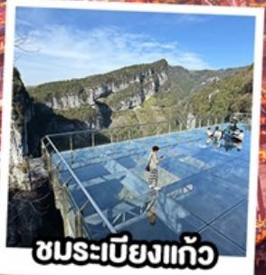
ชมกระเบื้องแก้ว