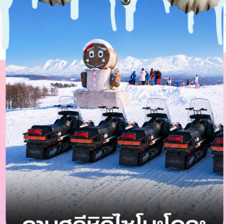
ลานสกีซึกิไซโนะโอกะ