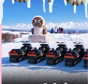
ลานสกีชิโกะโนะโอกะ