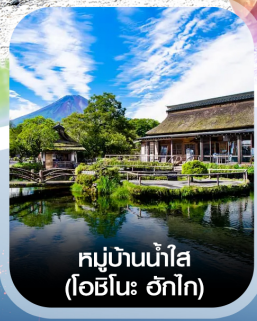
หมู่บ้านน้ำใส (โอชิโนะ อักไก)

✈️ คอนเฟิร์ม ออกเดินทาง ทุกพีเรียด 2 ท่านขึ้นไป