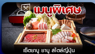
เมนูพิเศษ เซตซาซู ซาซู สีสัตสึเม็ง

โตเกียว-ฟูจิ-คามิโคจิ-ทะเลสาบคาวากุจิโกะ-หมู่บ้านน้ำใส-เมืองเก่าคาวาโกเอะ-คารุชิวาว่า-อีสระช้อปปิ้งเต็มวัน