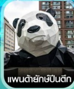
แพนด้ายักษ์ป็นตึก