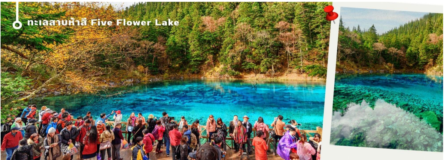
ทะเลสาบห้าสี Five Flower Lake

ทะเลสาบที่ใหญ่ที่สุด สูงที่สุด และลึกที่สุดในจิวจ้ายโกว ด้วยเนื้อที่กว่า 581 ไร่ ความยาวกว่า 7 กิโลเมตร และลึกถึง 103 เมตร ทอดตัวโค้งเป็นรูปพระจันทร์เสี้ยว เนื่องจากหิมะบนภูเขาละลายลงมา น้ำในทะเลสาบสีฟ้าสวยงาม ล้อมรอบด้วยยอดเขาสูงชัน และต้นไม้ใหญ่ที่ปกคลุมด้วยหิมะ งดงามราวหลุดออกมาจากภาพวาด ความพิเศษในช่วงฤดูหนาว ทะเลสาบจะกลายเป็นน้ำแข็งหนากว่า 60 ซม. ทำให้นักท่องเที่ยวนิยมมาเล่นสเก็ตน้ำแข็งกันเป็นจำนวนมาก