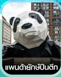
แพนด้ายักษ์ปิ่นตึก

คอนเฟิร์มออกเดินทาง ทุกพีเรียด 2 ท่านขึ้นไป