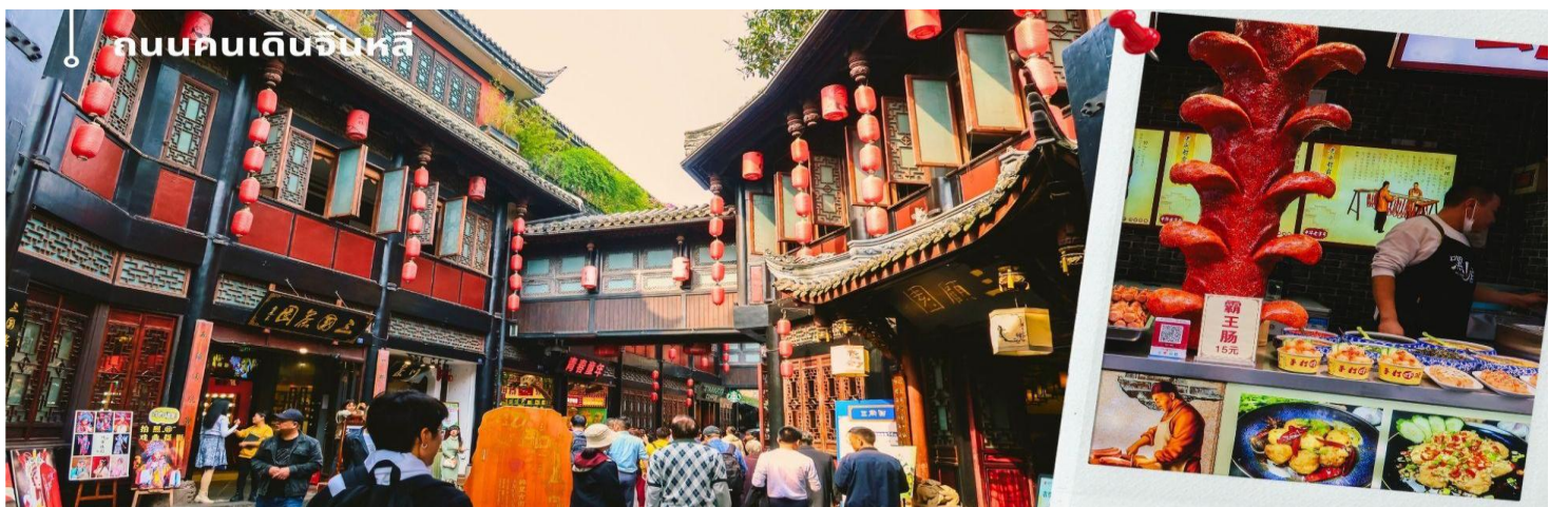
ถนนคนเดินจิ้นหลี่

นำท่านเดินเล่น ถนนโบราณจิ้นหลี่ เป็นหนึ่งในสถานที่ท่องเที่ยวที่น่าสนใจที่สุดสำหรับผู้ชื่นชอบประวัติศาสตร์และวัฒนธรรมจีน หมู่บ้านโบราณแห่งนี้มีความสำคัญอย่างยิ่งในเรื่องของประวัติศาสตร์ที่ยาวนานถึง 1,800 ปี ซึ่งเต็มไปด้วยวัฒนธรรมและขนบธรรมเนียมที่สะท้อนให้เห็นถึงวิถีชีวิตของคนจีนในยุคสมัยโบราณ จิ้นหลี่เป็นหนึ่งในสถานที่ท่องเที่ยวที่นักท่องเที่ยวจากทั่วโลกให้ความสนใจอย่างมาก เนื่องจากการท่องเที่ยวที่นี่สามารถสัมผัสได้ถึงกลิ่นอายของประวัติศาสตร์ที่หลากหลาย