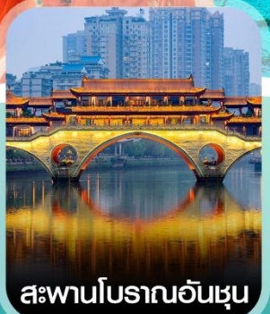
สะพานโบราณอันชุน