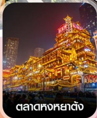
ตลาดหงหย่าตั้ง