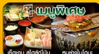
เซ็ชเชนุ สลัดญี่ปุ่น หมูย่างโอบิเอะ

ฮาคุบะ-นั่งกระเช้าชมวิว-คาเฟ่ City Breakery-ชิราคาวะโกะ-ทาคายาม่า-วัดน้ำใส-ช้อปปิ้งชินไซบาชิ-อิสระช้อปปิ้งเต็มวัน