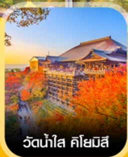
วัดน้ำใส คิโยมิจิ