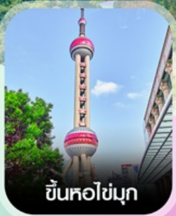
ขึ้นหอไข่มุก