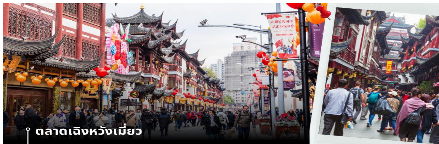
ตลาดเฉินหวังเหมียว

นำท่านเดินทางสู่ หมู่บ้านโบราณจูเจียเจี๋ย มีฉายาว่า เวนิซตะวันออกแห่งเมืองเซี่ยงไฮ้ เป็นอีกหนึ่งย่านเก่าริมน้ำที่มีชื่อเสียงในเซี่ยงไฮ้ มีประวัติศาสตร์ยาวนานกว่า 1700 ปี ซึ่งพื้นที่ทั้งหมดได้รับการอนุรักษ์ไว้เป็นอย่างดี จุดเด่นของเมืองโบราณแห่งนี้คือพื้นที่ด้านในนั้นมีแม่น้ำหลากหลายสายเชื่อมโยงไปยังพื้นที่ต่างๆ โดยรอบ ทำให้มีบรรยากาศที่สวยงามและร่มรื่น และให้ท่าน ล่องเรือ ชมวิวบ้านเรือนเก่าแก่ริมน้ำ ได้เวลาอันสมควรเดินทางสู่ มหานครเซี่ยงไฮ้ จากนั้นนำท่านสู่ ตลาดโบราณ 100 ปี เฉินหวังเหมียว เป็นศูนย์รวมสินค้า และอาหารพื้นเมืองที่แสดงถึงเอกลักษณ์ของชาวเซี่ยงไฮ้ซึ่งมีการผสมผสานระหว่างอดีตและปัจจุบันได้อย่างลงตัว ซึ่งเป็นย่านสินค้าราคาถูกที่มีชื่ออีกย่านหนึ่งของนครเซี่ยงไฮ้ ให้ท่านอิสระช้อปปิ้งตามอัธยาศัย