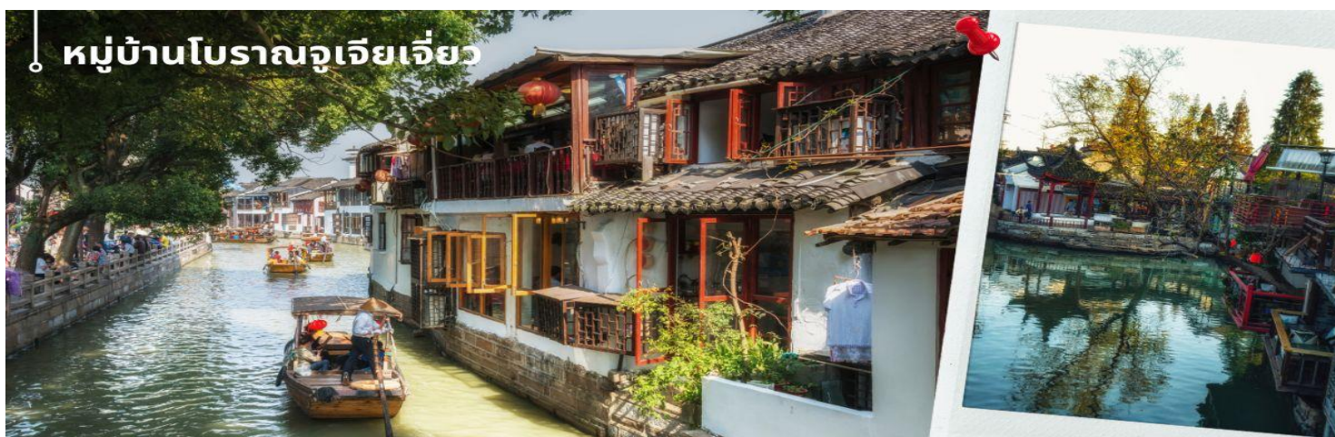
หมู่บ้านโบราณจูเจียเจี๋ย

📍รับประทานอาหารกลางวัน ณ ภัตตาคาร (4) เมนูพิเศษ ขาหมูร่ำรวย