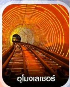
อุโมงเลเซอร์

✈️ คอนเฟิร์มออกเดินทาง ✈️ ทุกพีเรียด 2 ท่านขึ้นไป