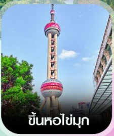
ขึ้นหอไข่มุก