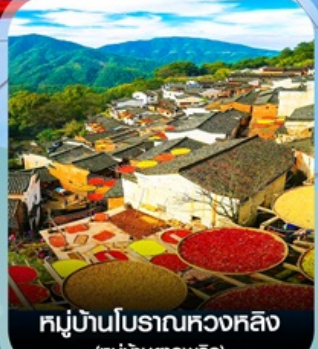
หมู่บ้านโบราณหวงหลิง (หมู่บ้านตากพรึก)