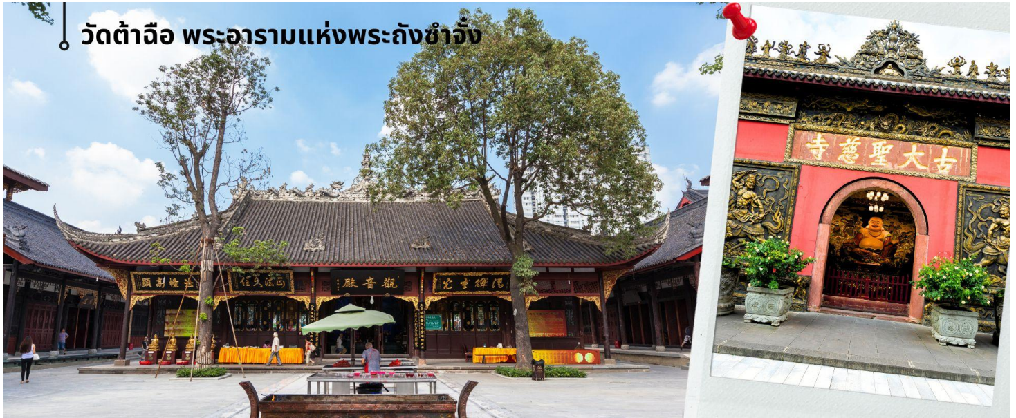
วัดต้าฉือ พระอารามแห่งพระถังซำจั๋ง

เดินทางกลับเชิงตุ้ม วัดต้าฉือ พระอารามแห่งพระถังซำจั๋ง ใจกลางนครเฉิงตู พระถังซำจั๋ง ได้รับการสรรเสริญว่าเป็นผู้มีความเพียร และมีชื่อเสียงมายาวนานกว่า 1,400 ปี และยังได้รับการยกย่องว่าเป็น พระไตรปิฎกแห่งราชวงศ์ถัง พุทธประวัติของพระถังซำจั๋งถูกจารึกในสถานที่ต่างๆมากมาย รวมไปถึงได้ถูกกล่าวถึงในจดหมายเหตุหลายเล่มตามเส้นทางการเดินทางแห่งความเพียรของท่าน รวมทั้งมีพระอัฐิของท่าน ประดิษฐานอยู่ในพระอารามของนครนานจิง และที่ทะเลสาบสุริยันจันทราเป็นเกาะใต้หวั่นอีกด้วย