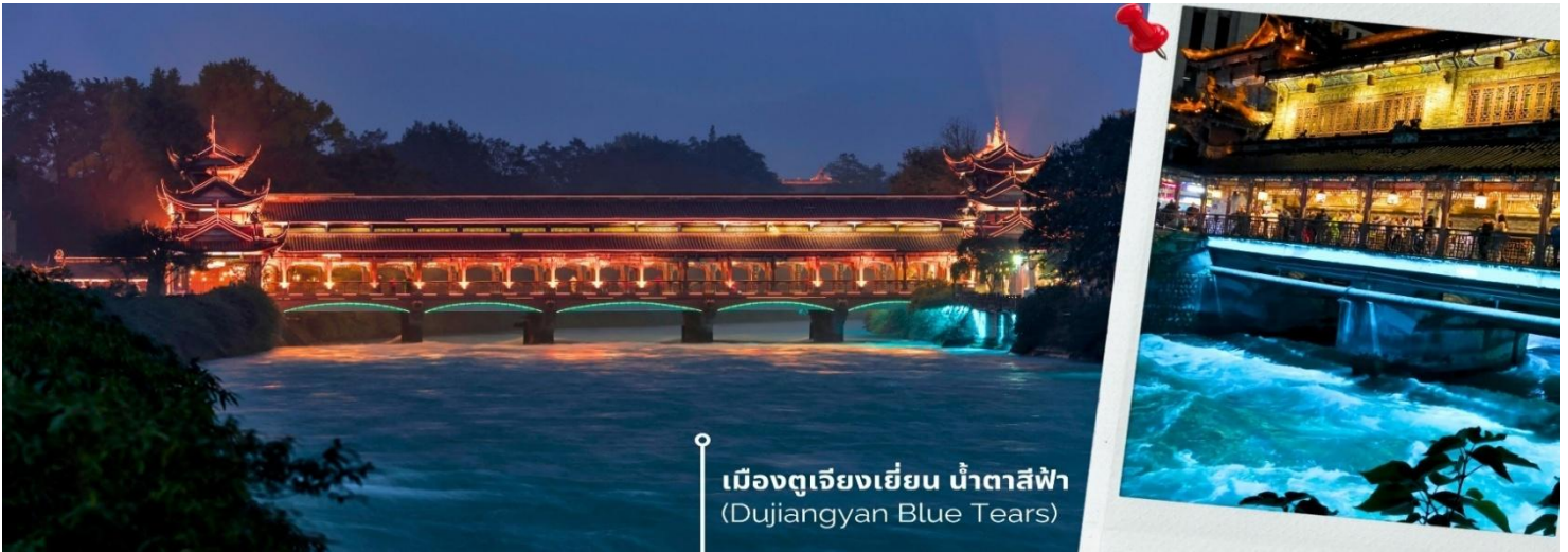
เมืองตูเจียงเยียน น้ำตาสีฟ้า (Dujiangyan Blue Tears)