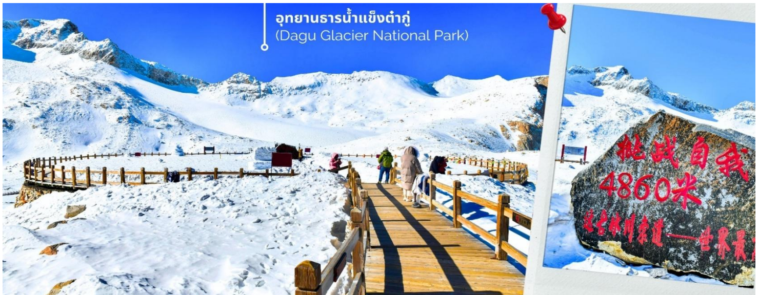
ความหนาวของหิมะขึ้นอยู่กับสภาพอากาศ

จากนั้นนำท่านเดินทางสู่ เมืองเฮยลู่ (ใช้เวลาเดินทางประมาณ 2 ชั่วโมง) เพื่อเดินทางไปยัง อุทยานธารน้ำแข็งต้ากู่ (รวมกระเช้าขึ้นลง) ต้ากู่ปิงชวน หรือ Dagu Glacier National Park เป็นธารน้ำแข็งกลาเซียร์ที่สวยงามที่สุดแห่งหนึ่งของโลกและเป็นสถานที่ท่องเที่ยวระดับ 4A ของจีน ตั้งอยู่ที่เมืองเฮยลู่ ในมณฑลเสฉวน ห่างจากเมืองเฉิงตู ประมาณ 300 กิโลเมตร ถือเป็นธารน้ำแข็งที่อายุน้อยที่สุด ที่ตั้งอยู่ในระดับความสูงที่ต่ำที่สุดและอยู่ใกล้กับเมืองมากที่สุด ในบรรดาธารน้ำแข็งทั้งหมด โดยอยู่สูงจากระดับน้ำทะเลประมาณ 3,800-5,100 เมตร จุดสูงที่สุดที่นักท่องเที่ยวสามารถขึ้นไปได้จะอยู่ที่ 4,860 เมตร