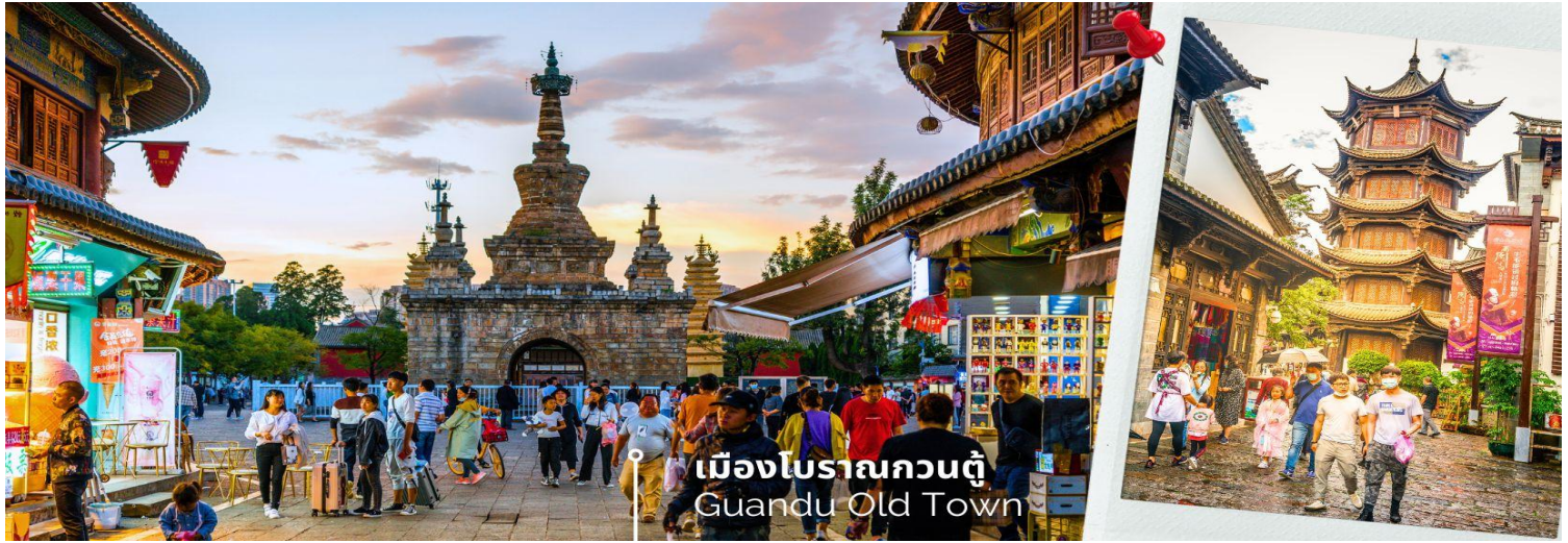
เมืองโบราณกวนตุ๋ Guandu Old Town

นำท่านชมบรรยากาศ เมืองโบราณกวนตุ๋ (Guandu Old Town) เป็นหนึ่งในต้นกำเนิดของวัฒนธรรมยูนนาน และยังถือเป็นหนึ่งในภูมิทัศน์ทางประวัติศาสตร์และวัฒนธรรม ที่สำคัญของเมืองคุนหมิง เมืองโบราณแห่งนี้ยังคงเป็นศูนย์กลางทางการค้าและคมนาคมที่สำคัญ ในอดีตเคยเป็นหมู่บ้านชาวประมงในสมัยราชวงศ์ถัง เมืองกวนตุ๋ยังเป็นเมืองแรกๆ ที่ศาสนาพุทธทางทิเบตได้เริ่มเผยแผ่เข้ามาในดินแดนยูนนาน