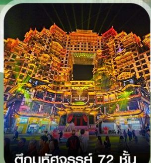
ตีทม์คัลเจอร์รี่ 72 ชั้น