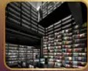
ชมร้านหนังสือ