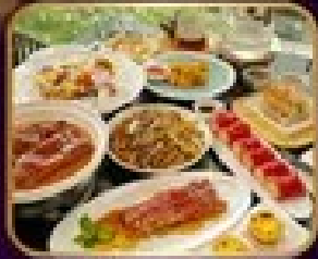
อาหารจีน 10 อย่าง