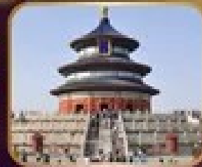
ชมความงดงาม