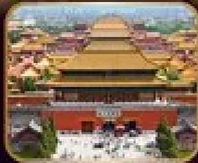
เจ๊ิงมรดกโลก