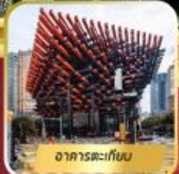
อาคารตะเกียบ