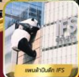
แพนด้าในตึก IFS