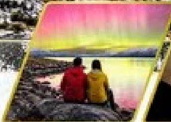
ตามล่าหาแสงใต้