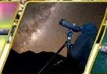
กิจกรรมชมทิวทัศน์ดาว