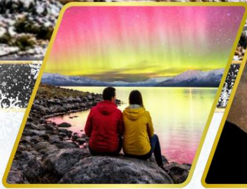
ตามล่าหาแสงใต้