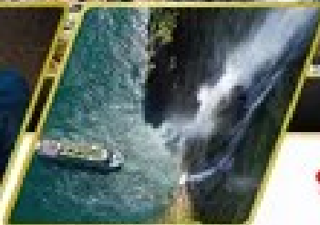
ล่องเรือมิลฟอร์ด ซาวน์