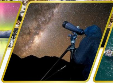
กิจกรรมชมทิวทัศน์ดาว