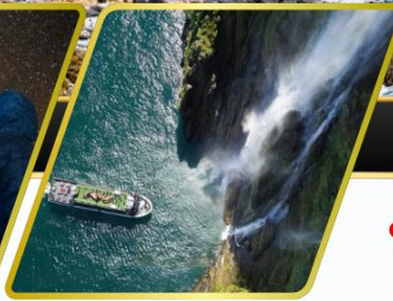
ล่องเรือมิลฟอร์ด ซาวน์