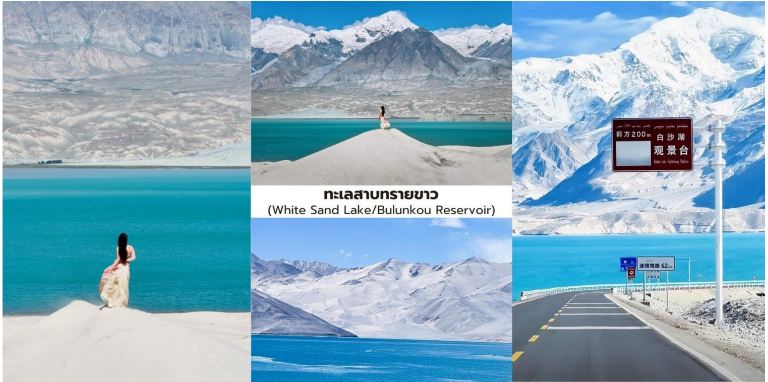
ทะเลสาบทรายขาว (White Sand Lake/Bulunkou Reservoir)

เป็นหนึ่งในจุดถ่ายภาพที่มีชื่อเสียงของเส้นทางสายปามิร์ ทิวทัศน์บริเวณนี้ยังมีฉากหลังเป็น ยอดเขาคองกูร์ (Kongur Tagh) สูง 7,719 เมตร ซึ่งช่วยเพิ่มความอลังการของภูมิประเทศและทำให้สถานที่แห่งนี้ ได้รับการขนานนามว่าเป็น “สวรรค์บนดินของซินเจียง” ระยะทางจากทาชเคอร์กันประมาณ 130 กิโลเมตร ใช้เวลาเดินทางราว 2.5 ชั่วโมง ช่วงเช้าเป็นเวลาที่เหมาะสำหรับการถ่ายภาพ เนื่องจากแสงสวยและลมสงบ