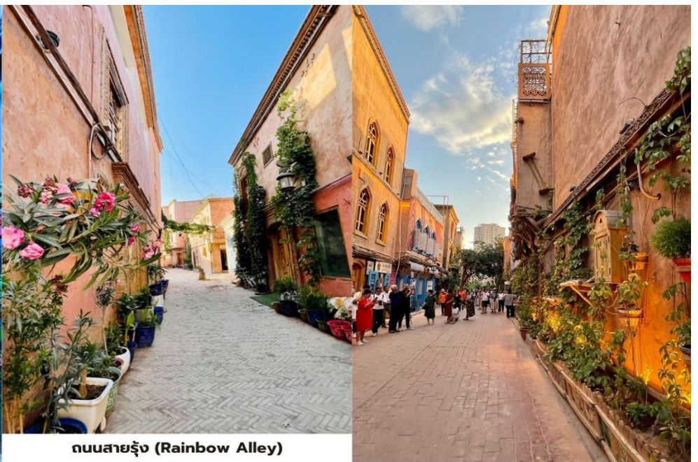
ถนนสายรุ้ง (Rainbow Alley)