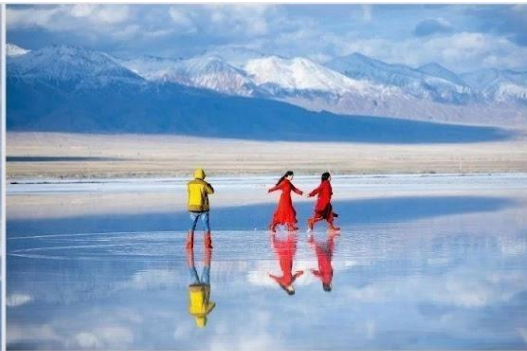
"ทะเลสาบเกลือชาการ์" (Chaka Salt Lake)