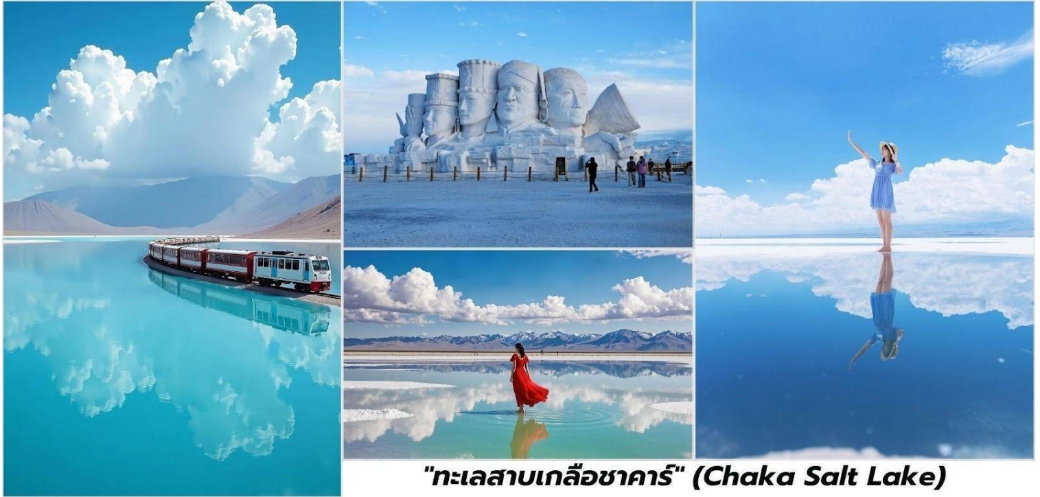
"ทะเลสาบเกลือชาคาร์" (Chaka Salt Lake)

จากนั้นนำท่านชม ทะเลสาบเกลือชาคาร์ (Chaka Salt Lake) "กระจกแห่งท้องฟ้า" แห่งมณฑลชิงไห่ สวรรค์ของนักถ่ายภาพ ตั้งอยู่ในเขตปกครองตนเองไช่ มองโกลและทิเบต มณฑลชิงไห่ ประเทศจีนเป็นหนึ่งใน ทะเลสาบเกลือธรรมชาติที่มีชื่อเสียงระดับโลกและได้รับการยกย่องว่าเป็น "กระจกแห่งท้องฟ้า" (Mirror of the Sky) ด้วยทัศนียภาพอันน่าทึ่งของผิวน้ำที่ใสราวคริสตัลสะท้อนภาพท้องฟ้าก้อนเมฆและภูเขาโดยรอบได้อย่างสมบูรณ์แบบ ราวกับภาพวาดที่เมื่อจิ่งกลายเป็นจุดหมายปลายทางยอดนิยมสำหรับนักท่องเที่ยวและนักถ่ายภาพที่ต้องการเก็บภาพ ความงามอันเป็นเอกลักษณ์