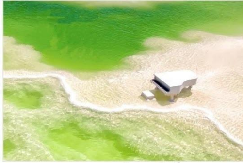
ทะเลสาบเกลือจาเอ๋อฮั่น (Chaerhan Salt Lake)