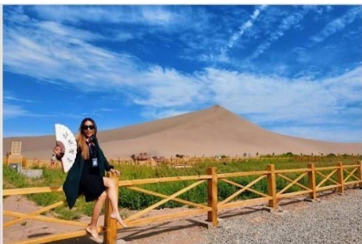
ทะเลทรายหมิงซาซาน (鳴沙山)