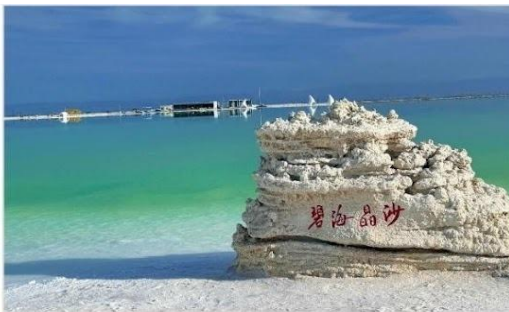
ทะเลสาบเกลือจาเอ๋อฮั่น (Chaerhan Salt Lake)