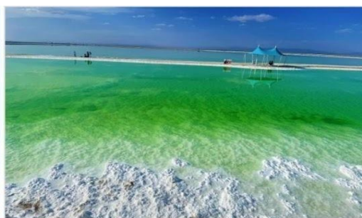
ทะเลสาบเกลือจาเอ๋อฮั่น (Chaerhan Salt Lake)