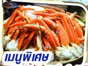
เมนูพิเศษ บุฟเฟ่ต์ชาปู 1 ชนิด