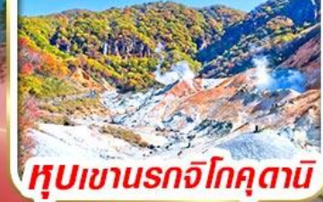
หุบเขานรกจิกุคุตามิ

รวม ค่าภาษีที่ปรับขึ้นแล้ว (ประกาศ 1 เม.ย. 69)