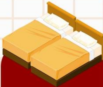
ห้องพักเตียงคู่ (SINGLE BED ROOM)

ห้องพักสำหรับนอนท่านเดียว แต่มีค่าใช้จ่ายเพิ่มเติม จากค่าทัวร์