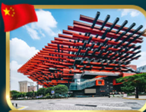
แลนด์มาร์กจั๊ว ตึกตะเกียบ