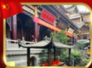
ขอพรวัดหลัวอัน จงชิ่ง