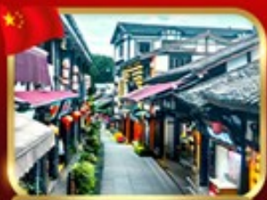
หมู่บ้านโบราณฉือซีชิว