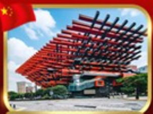
แลนด์มาร์กจิ่ง ตึกตะเกียบ