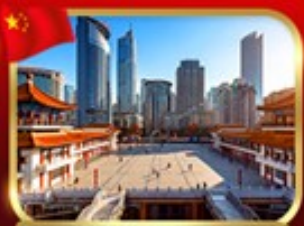
เขื่อนตึกไคว่ซิงโหล