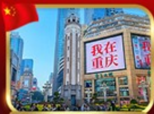
ถนนคนเดินจียางเป่ย์

OPTION ซีดีตัวร้องฮิง ชมสวนดอกไม้, ช้อปปิ้ง, ถนนคนเดิน