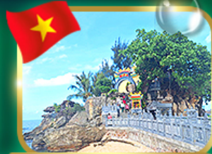
สักการะขอพรศาลเจ้าดิงเกา