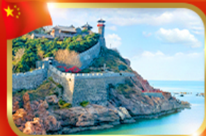
ศาลาฉิงไห่ เมืองซานตง