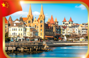
ท่าเรือฟิชชอร์แมนไต้หวัน