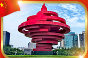
จัตุรัส 54 แลนด์มาร์กซิงเต่า