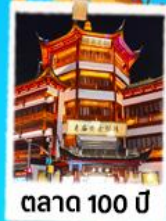
ตลาด 100 ปี