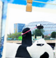
แพนด้าเซลฟี่