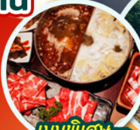
เมนูพิเศษ ชาบูหม่าล่า