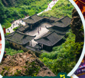
อุทยานหลุมฟ้า สะพานสวรรค์