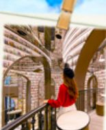
ร้านหนังสือ