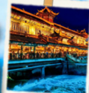
เขื่อนน้ำสีฟ้า